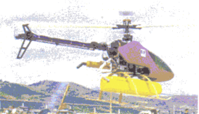
Helicóptero semiautónomo.

2b. Robots oceânicos. Os robots oceânicos funcionam à superfície, como navios autónomos de superfície (usados para fins de pesquisa oceanográfica) ou submersos. Por exemplo, o robot oceanográfico Caravela , operando sem intervenção humana e com uma larga autonomia, é movido através de propulsores constituídos por motores eléctricos associados a hélices. A maioria dos robots submarinos é movida do mesmo modo, sendo o controlo de orientação efectuado através de lemes horizontais e/ou verticais. Os robots submarinos correntes estão dotados de propulsores, com alimentação eléctrica fornecida por um sistema de baterias.