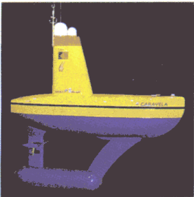
Navio autónomo Caravela.

A locomoção é o mecanismo que permite que um robot se mova. As estratégias de locomoção presentes nos robots móveis são função das aplicações e dos ambientes em que os robots operam e resultam da necessidade de responder a perguntas do tipo: Qual é a velocidade máxima desejada? O robot precisa de vencer escadas ou pavimentos irregulares? O robot tem de sobrevoar o terreno? O robot apoia-se numa superfície ou move-se em ambiente aquático ou aéreo? Com base na aplicação, e conseqüentemente no tipo de ambiente em que se movem, há quatro grandes categorias de robots móveis: